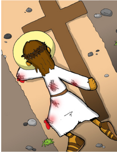
9º ESTACIÓN: JESÚS CAE POR TERCERA VEZ