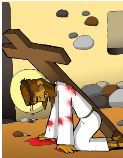
3º ESTACIÓN: JESÚS CAE POR PRIMERA VEZ