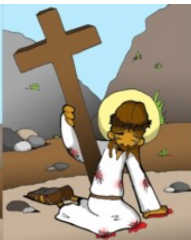
7º ESTACIÓN: JESÚS CAE POR SEGUNDA VEZ