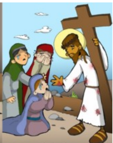
8º ESTACIÓN: JESÚS CONSUELA A LAS MUJERES DE JERUSALÉN