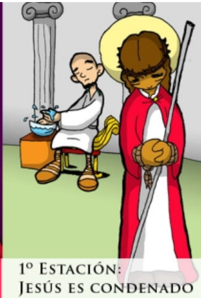
1º ESTACIÓN: JESÚS ES CONDENADO