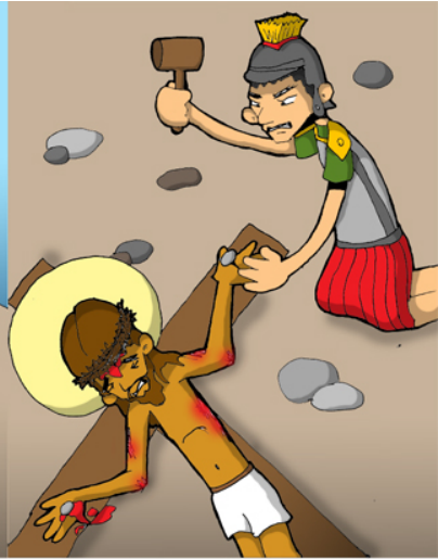
11º ESTACIÓN: JESÚS ES CLAVADO EN LA CRUZ