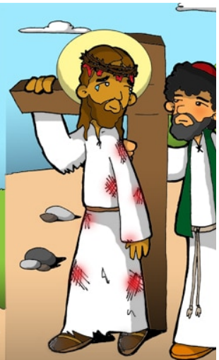
5º ESTACIÓN: EL CIRENEO A JESÚS A CARGAR LA CRUZ