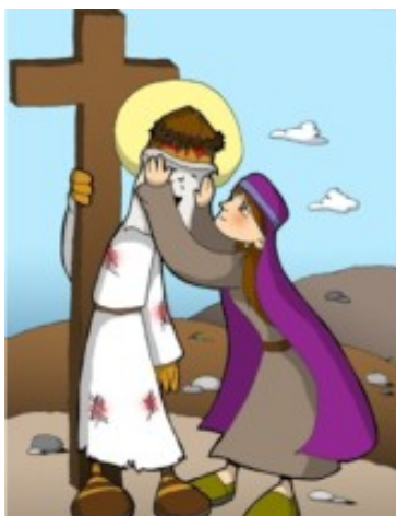
6º ESTACIÓN: LA VERÓNICA ENJUGA EL ROSTRO DE JESÚS