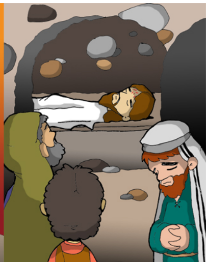
14º ESTACIÓN: JESÚS ES SEPULTADO