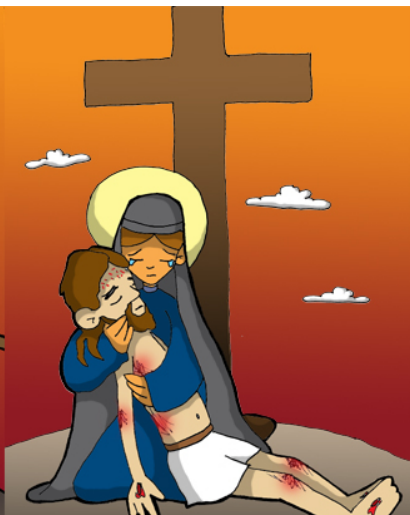
13º ESTACIÓN: JESÚS ES BAJADO DE LA CRUZ