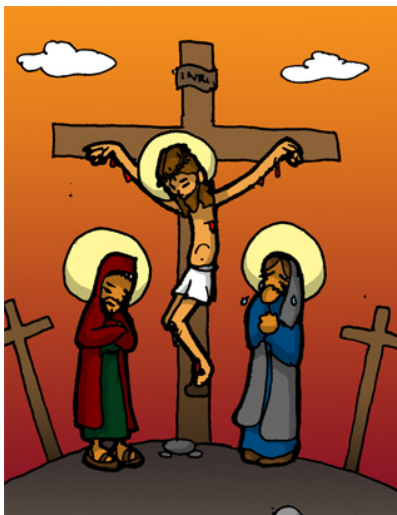
12º ESTACIÓN: JESÚS MUERE EN LA CRUZ