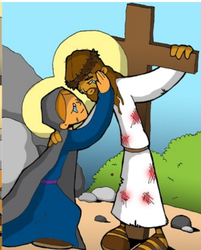
4º ESTACIÓN: JESÚS SE ENCUENTRA CON SU MADRE